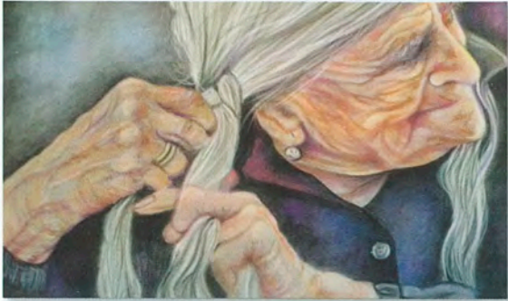
Piacere personale - 32x25

Il pastello è per me libertà di espressione: la luminosità del colore e la sua forza sono gli elementi che più mi fanno amare questa tecnica. Con esso riesco a rappresentare i miei amati paesaggi canavesani e i forti contrasti di luci ed ombre.