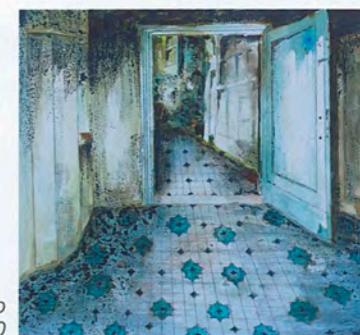
Passaggio segreto 30x40

Nell'acquerello cerco di rappresentare le immagini di una realtà vissuta nelle curve della memoria!