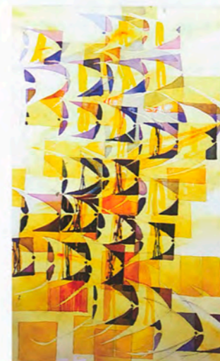
Scalari gialli 76x56

Tel. 340 7734478 felicità.costa@alice.it