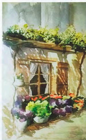
La finestra 40x60

Disegnare e dipingere contribuiscono a formare e arricchire l'essere umano. Il riconoscermi attraverso i segni e i colori rappresenta un'emozionante espressione del mio sentire.