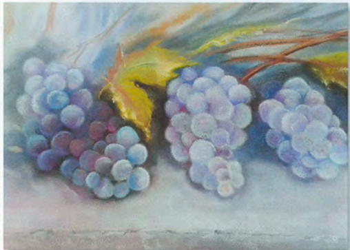
È tempo di vendemmia - 25x50