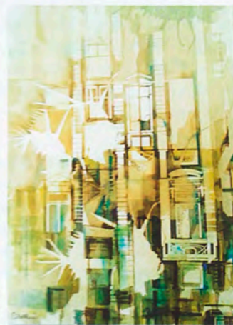
Ascensional street 76x56